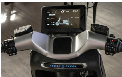
电动车 / 摩托车